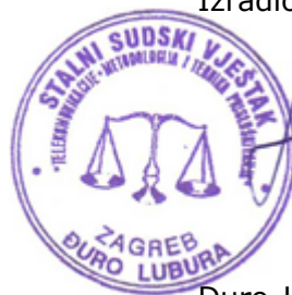
Đuro Lubura stalni sudski vještak